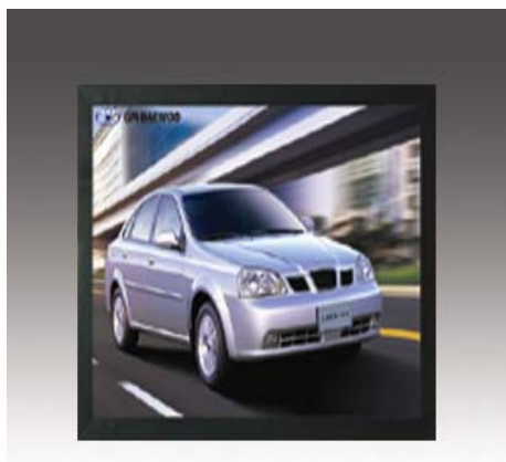
Standard färger på ramen är silver eller svart